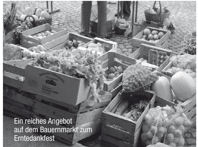
Ein reiches Angebot auf dem Bauernmarkt zum Erntedankfest