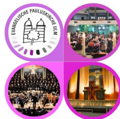
... damit weiter Gutes drin ist! Außensanierung der Pauluskirche

Wir freuen uns, wenn sich jemand findet, der hier in 25 Briefkästen den Gemeindebrief monatlich einwerfen kann.