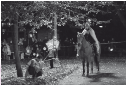
Martinsumzug mit Ross und Reiter

Am Mittwoch, 11. November 2009 wird es einen Martinsumzug mit Ross und Reiter geben.